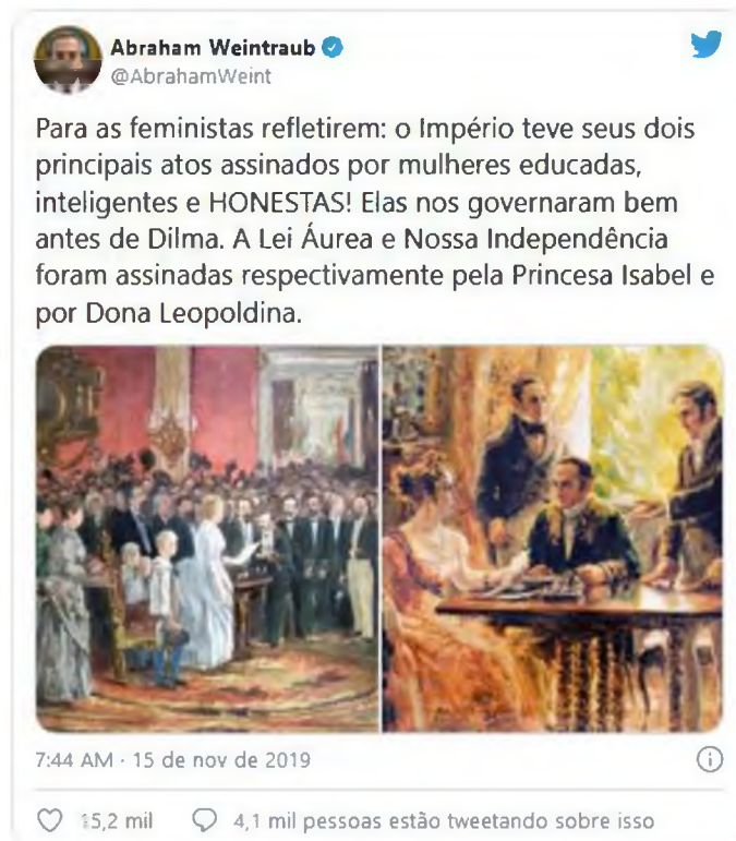
Figura 3. Material publicado pelo ex-Ministro da Educação em 15 de setembro de 2020 em seu perfil na plataforma digital Twitter.