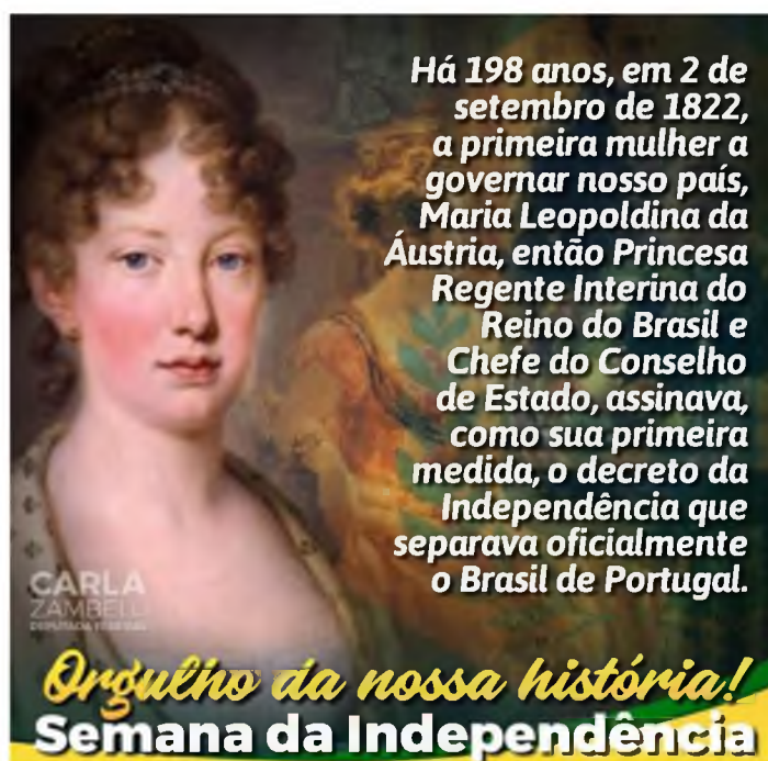
Figura 2. Material das redes sociais da deputada federal Carla Zambelli (PSL-SP) publicado em seu “Facebook” no dia 2 de setembro de 2020.