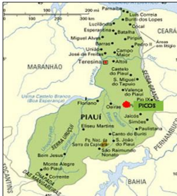
Figura 1 - Mapa Político do Piauí destacando Picos-PI 3