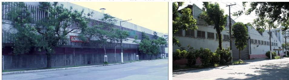
Figura 5 — Avenida Presidente Wilson: Fábricas Lorenzetti e Arno.