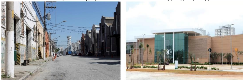
Figura 4 — Avenida Henry Ford: galpões e Mooca Plaza Shopping – (antiga fábrica da Ford).

Fonte: Autor, 2018 e ABC do ABC. Mooca Plaza Shopping faz projeção mapeada com história do bairro. 17 ago. 2017. 9