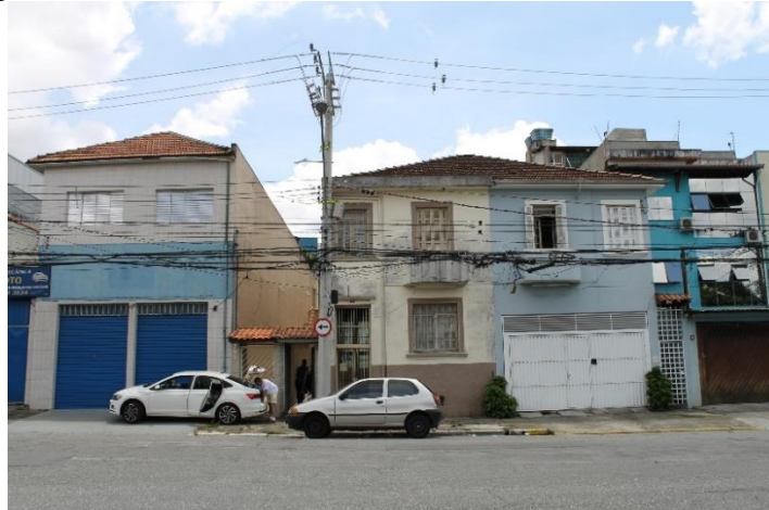
Figura 8 — Rua Canuto Saraiva: sede atual da ATRM (casa bege).