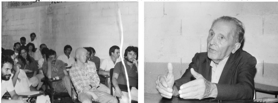
Figura 9 — Palestra Luís Carlos Prestes na ATRM -10 dez 1987.

Eu trouxe o Prestes aqui, com o Prestes tem foto! Do Prestes veio pouca gente, nós já távamos num período meio de descenso quando ele veio. Mas, ele acabou fortalecendo a militância, aquelas pessoas que se aglutinavam em torno da Associação. Mas, ele veio, falou da conjuntura, né, o Prestes. Até deixou uns endereços pra nós aqui de velhos comunistas. Eu fui visitar um do endereço que ele deixou. (MANOEL, 2016).