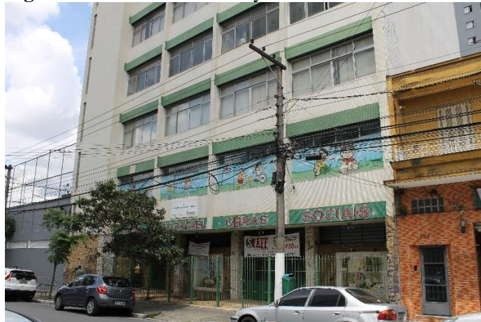
Figura 7 — Rua Orville Derby: Centro Social São Rafael.

O Centro Social da Paróquia Igreja São Rafael é, assim, um lugar da memória fundante e problemática para ambos os movimentos em virtude da posição de classe e assistencialista dos paroquianos, oposta aos princípios da OSM, de autonomia organizativa da classe trabalhadora no chão de fábrica e nos bairros frente às instituições sindicais, partidárias, estatais e religiosas.