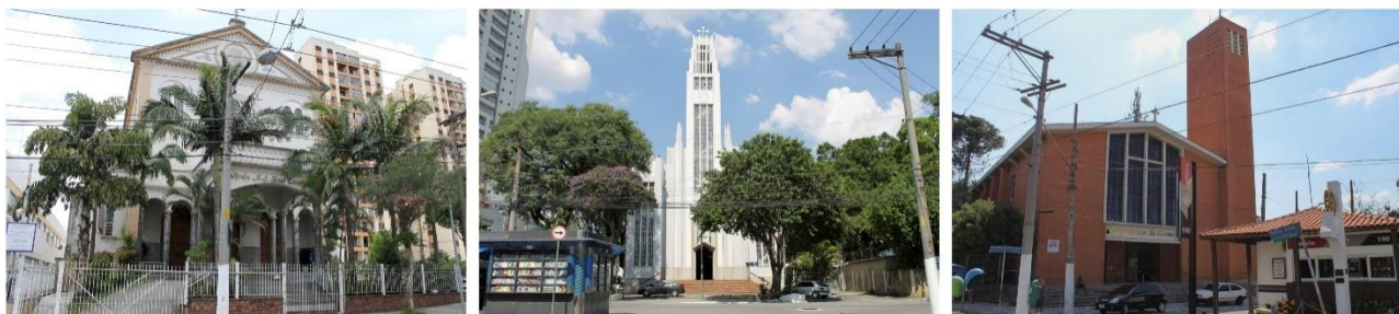
Figura 2 — Igrejas N. Sra. do Bom Conselho, São Rafael e N. Sra. do Carmo.

Igreja Bom Conselho, a Paróquia São Rafael, situadas na Mooca; e a Paróquia Nossa Senhora do Carmo, na Vila Alpina.