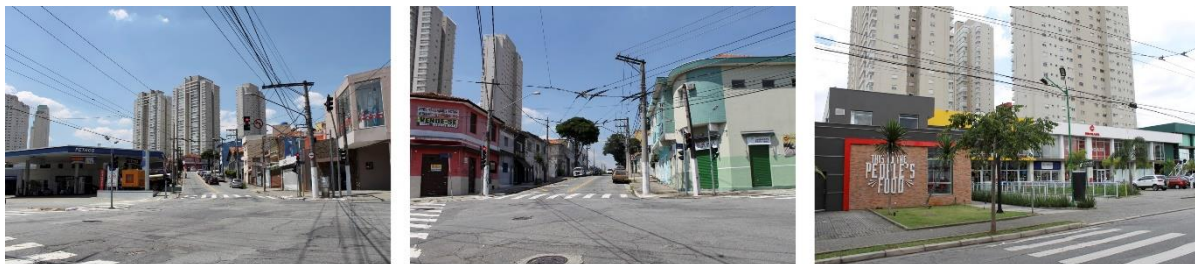
Figura 6 — Subida da Rua Tobias Barreto e lojas (antiga Fábrica Securit)