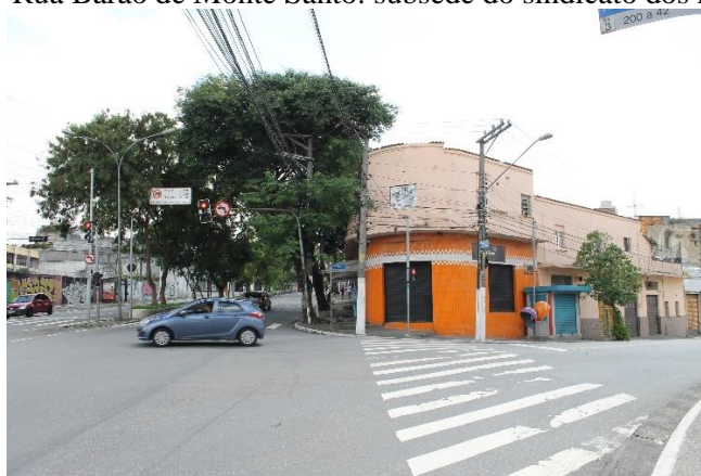
Figura 1 — Rua Barão de Monte Santo: subseção do sindicato dos metalúrgicos.

Em 79 a Oposição conseguiu, um pouco até com a concessão dos sindicato [oficial] pra não perder a rédea da coisa, (...) criar subseções... criei (...) comitês de campanha, aqui mesmo a gente teve um aqui na Barão de Monte Santo aqui (...) Se bem que eles mandaram a polícia depois pra prender todo mundo. (ADALBERTO, 2016).